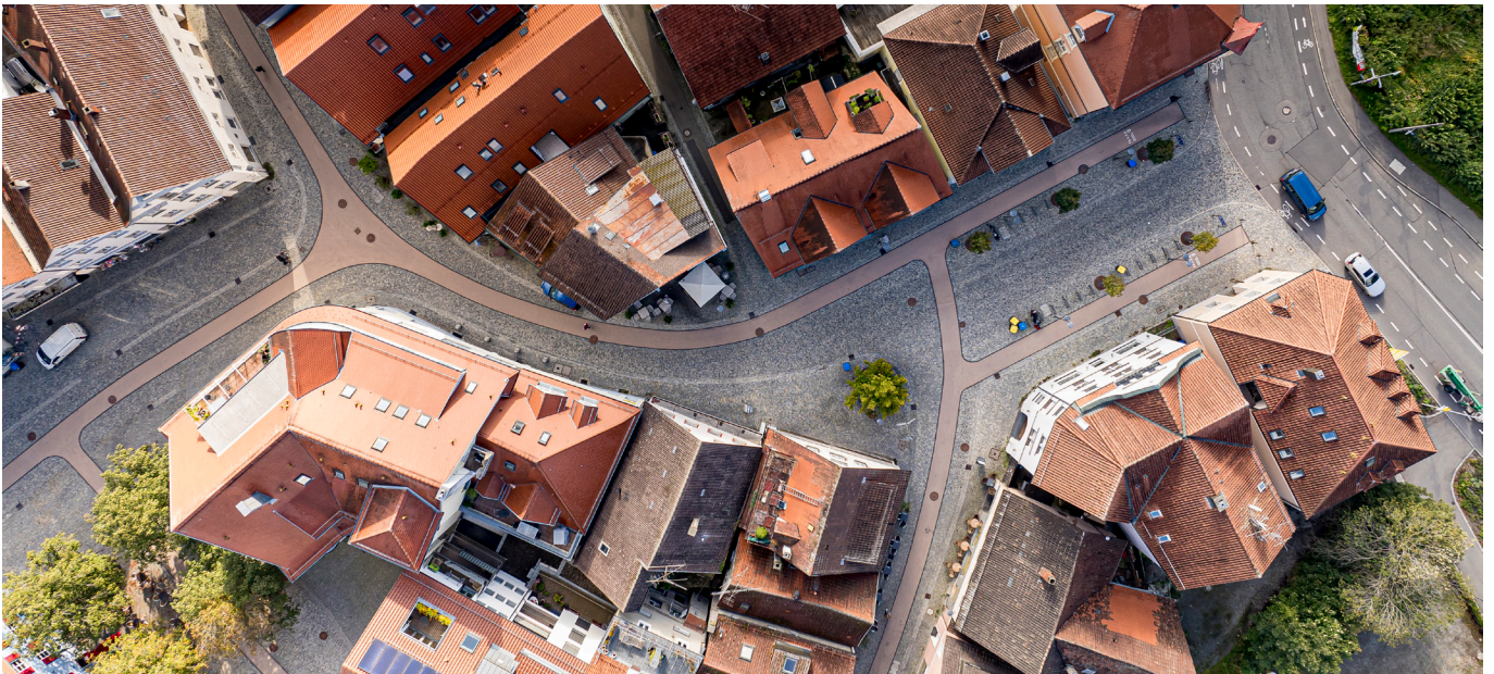
Nationales Projekt des Städtebaus „Altstadt für Alle“ in Bad Waldsee

Wo es erforderlich ist, entwickeln wir durch strategische Gesamtkonzepte oder fundierte Machbarkeitsstudien belastbare Entscheidungsgrundlagen, die die städtebauliche Qualität als zentrales Förderargument betonen.